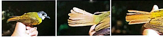
Gambar 1. Foto A. phaeocephalus connectens . Keterangan: Kiri foto jenis, tengah dan kanan foto bagian ekor.

Dalam penelitian ini ditemukan Alophoixus phaeocephalus connectens Empuloh irang dengan bulu ekor tanpa warna kuning pada ujungnya. Menurut MacKinnon, dkk. (2010) Empuloh irang tanpa warna kuning pada ujung bulu ekor hanya terdapat di Kalimantan. Sedangkan yang tersebar di Sumatera memiliki warna kuning pada ujung bulu ekor. Untuk itu, temuan ini merupakan catatan baru ( new record ) untuk distribusi jenis Empuloh irang di Sumatera.