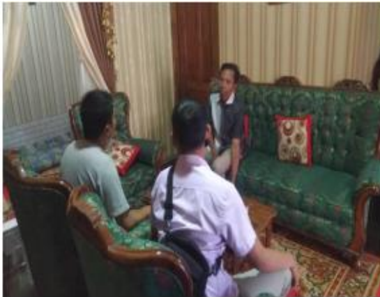
Gambar 2. Identifikasi masalah mitra