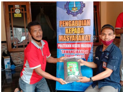
Produk kegiatan pelatihan