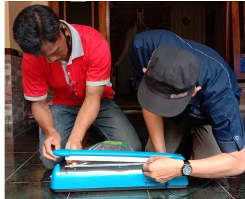
Proses packaging menggunakan sealer machine