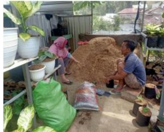
Gambar 3. Proses pembuatan media tanam