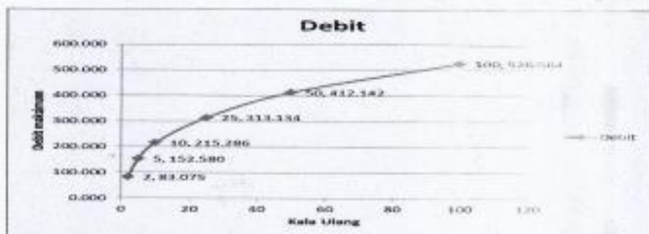
Gambar 3. Grafik Debit Puncak pada DAS Air Kungkai