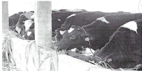
Gambar 1. Penambahan lima ekor ternak sapi perah unggul