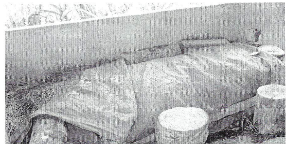
Gambar 3. Proses Fermentasi Jerami Sebagai sumber pakan alternatif