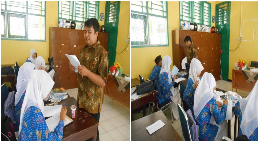
Foto saat menyebarkan angket uji coba dikelas XI IPA 1 dan XI IPA 2 pada tanggal 21 April 2014