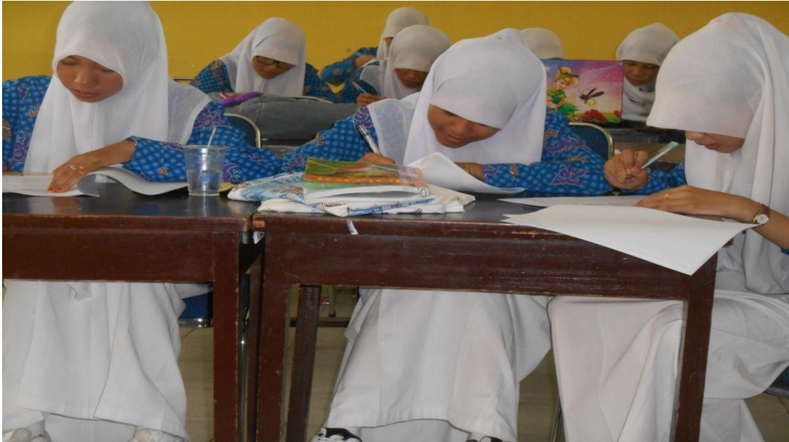
Foto saat menyebarkan angket ( Posttest ) di kelas XI IPA 4 pada tanggal 19 Mei 2014