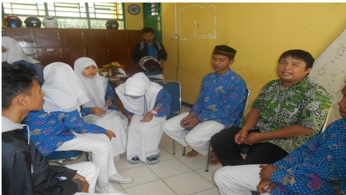
Foto saat memberikan layanan bimbingan kelompok berbasis multimedia kedua di kelas XI IPA 4 pada tanggal 3 Mei 2014