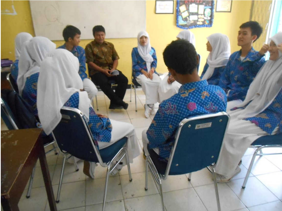
Foto saat memberikan layanan bimbingan kelompok berbasis multimedia pertama di kelas XI IPA 4 pada tanggal 28 April 2014