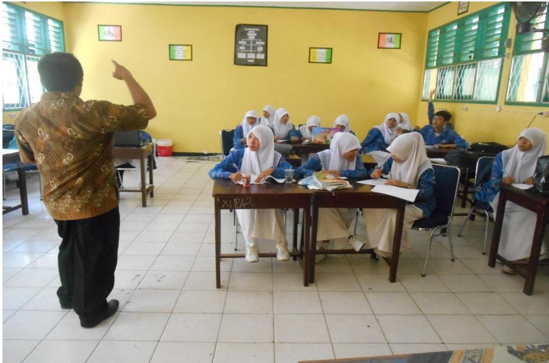
Foto saat menyebarkan angket ( Pretest ) di kelas XI IPA 4 pada tanggal 24 April 2014