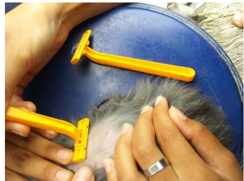
Proses Pencukuran Rambut Kelinci