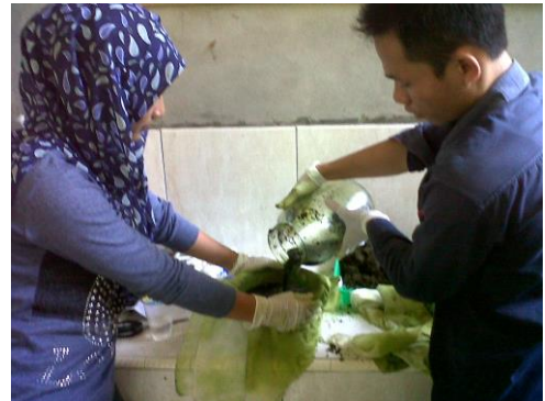
Proses Pembuatan Ekstrak