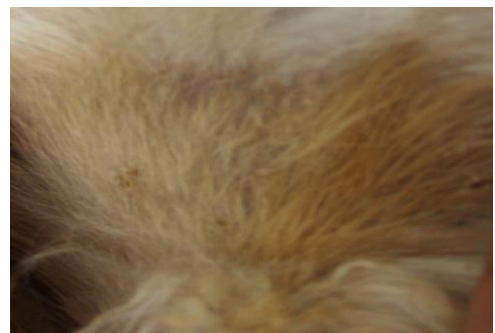
Gambar 2 Punggung Kelinci yang diberi daun Waru