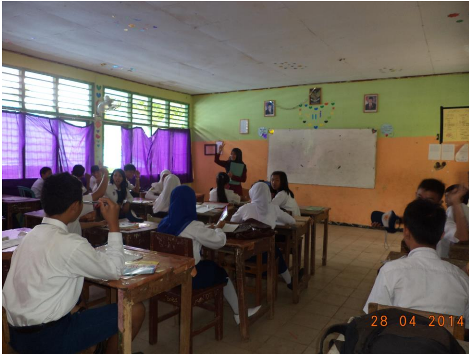
Mengajar Di kelas