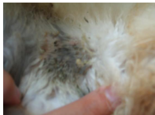
Pengolesan Pada Punggung Kelinci