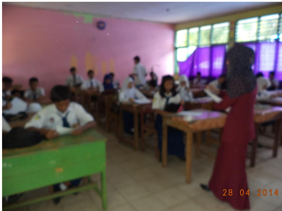
Siswa Mengerjakan Post Test