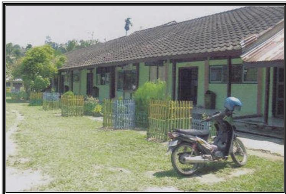
Gambar 2: Ruang Kantor Sekolah Menengah Atas Negeri 2 Seluma