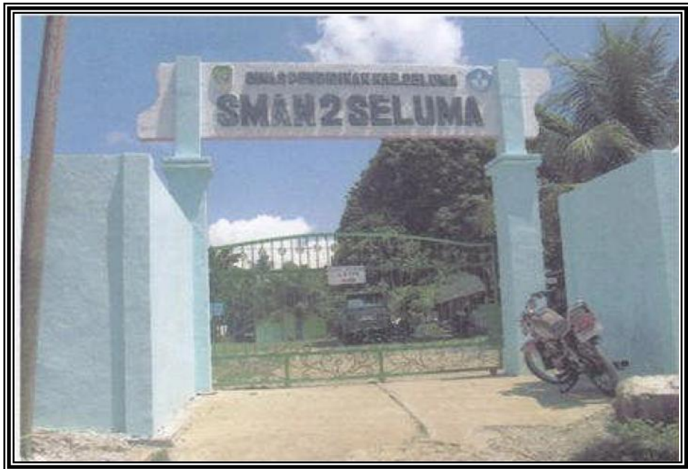
Gambar 1: Gerbang Sekolah Sekolah Menengah Atas Negeri 2 Seluma