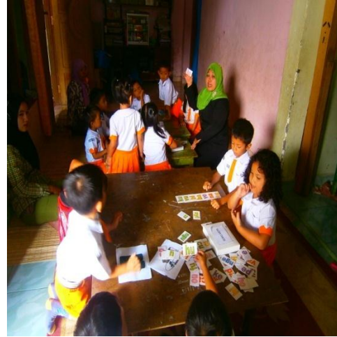
Mencari dan menyebutkan suku kata Gambar