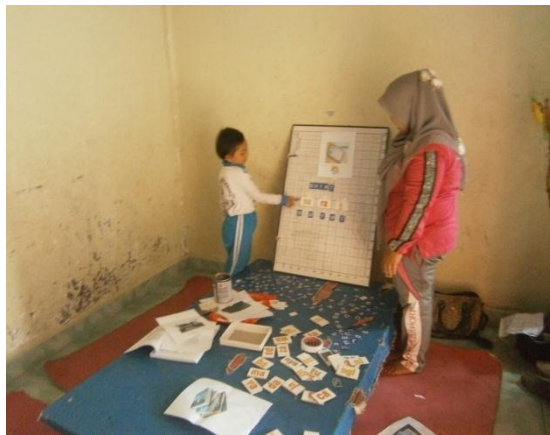
Menyusun dan mengucapkan suku kata yang telah dibuat