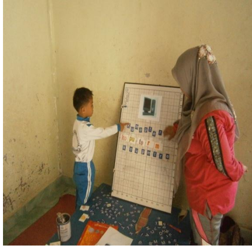
Anak yang masih dibimbing Menyusun dan mengucapkan suku kata yang telah dibuat