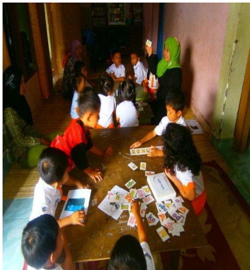
Menyusun kata nama gambar dan menggambil gambar yang sesuai dengan kata yang disusun