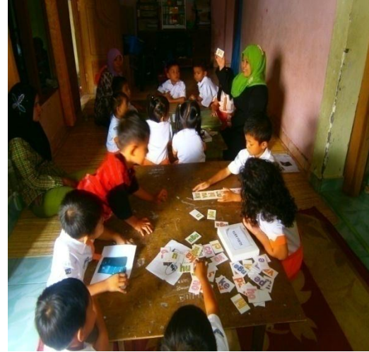
Diskusi kelompok dalam kegiatan memberi nama gambar