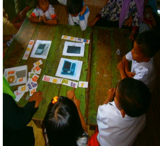
Menyusun suku kata membentuk kata nama gambar secara bergantian