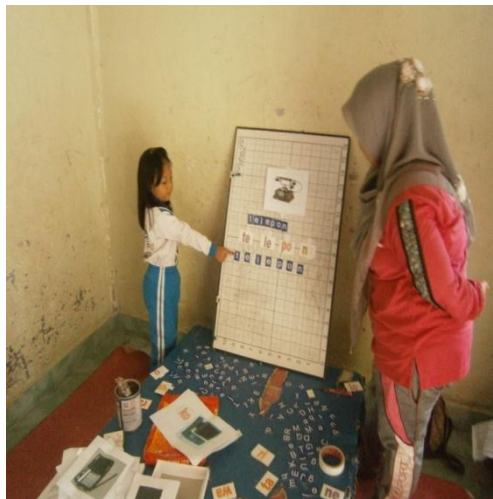
Menyusun dan mengucapkan suku kata yang telah dibuat