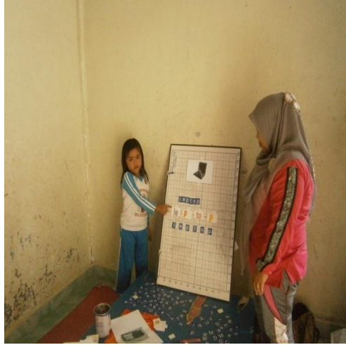
Menyusun dan mengucapkan suku kata yang telah dibuat