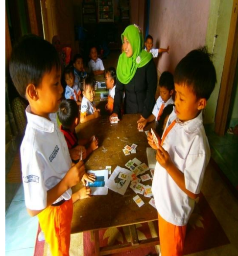
Main tebak suku kata dengan teman