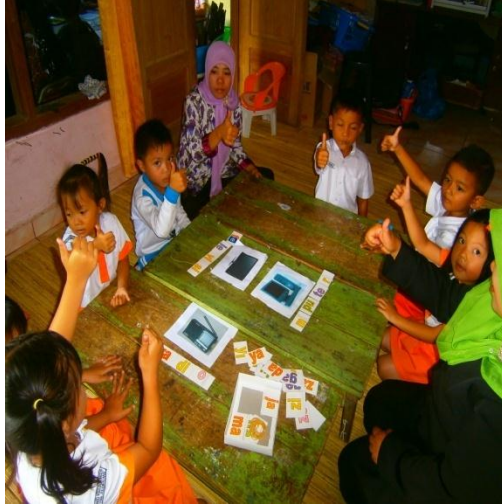
Kelompok yang tercepat memberi nama gambar dengan tepat