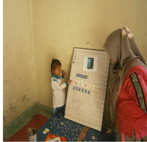
Anak yang sudah mandiri Menyusun dan mengucapkan suku kata yang telah dibuat