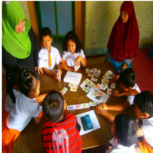
Memberi nama gambar dengan suku kata berdasarkan urutan