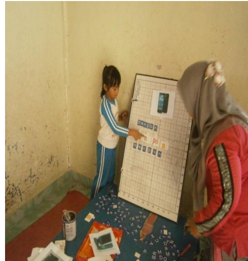
Anak yang sudah mandiri Menyusun dan mengucapkan suku kata yang telah dibuat