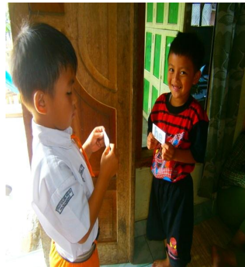
Main tebak suku kata dengan teman