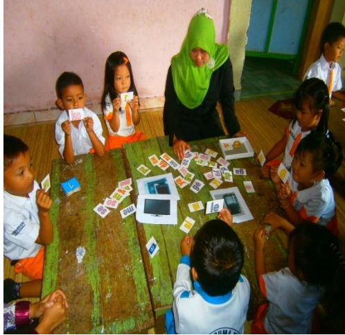
Mencari suku kata gambar berdasarkan Urutan dari kawan