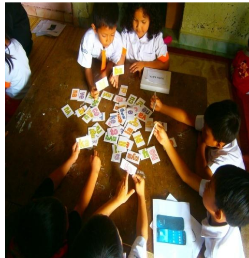
Mengambil gambar kemudian Menyusun kata nama gambar sesuai dengan gambar yang diambilnya