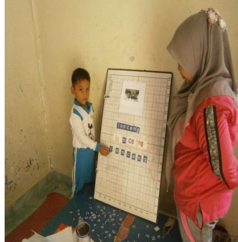
Menyusun dan mengucapkan suku kata yang telah dibuat