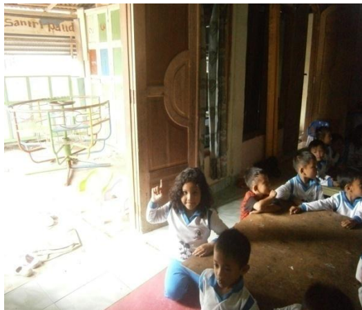
Acungkan jari tanda mengerti tentang permainan yang akan dilaksanakan