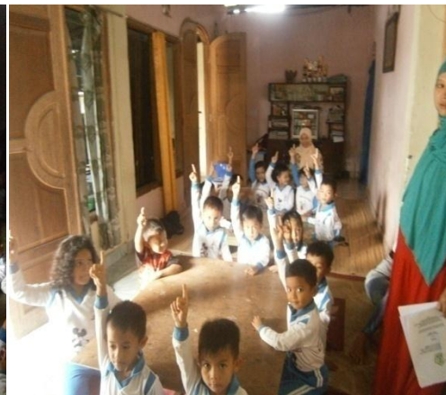
Acungkan jari untuk mau mengikuti kegiatan