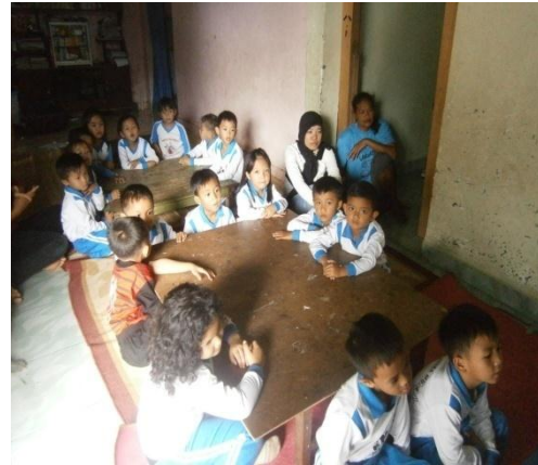
Anak mendengarkan penjelasan dari guru tentang kegiatan yang akan dilaksanakan