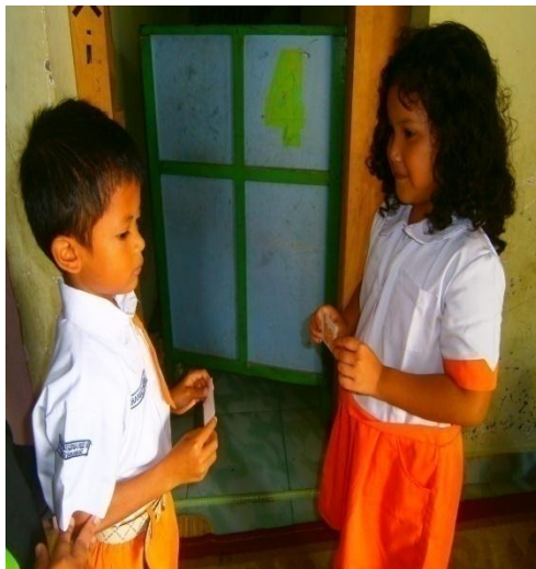
Main tebak suku kata dengan teman