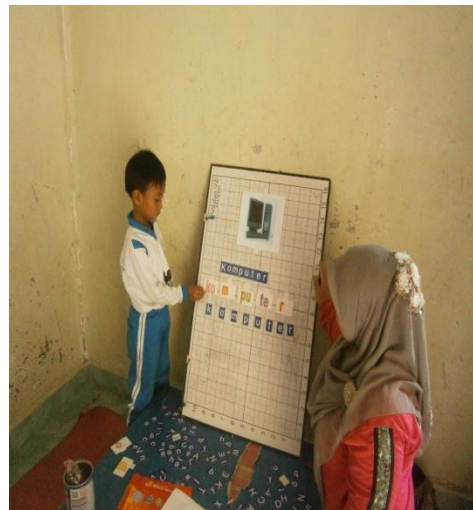
Menyusun dan mengucapkan suku kata yang telah dibuat