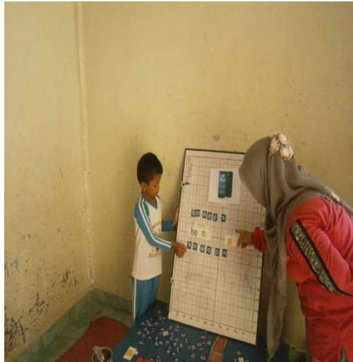
Anak yang masih dibimbing Menyusun dan mengucapkan suku kata yang telah dibuat