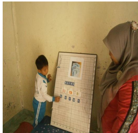
Menyusun dan mengucapkan suku kata yang telah dibuat