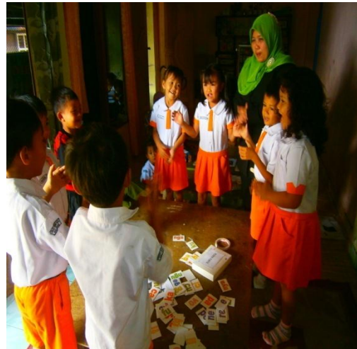
Mendapat hukuman bernyanyi karena ada pemberian nama gambar yang hurufnya kurang