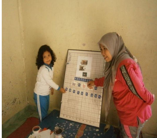
Menyusun dan mengucapkan suku kata yang telah dibuat