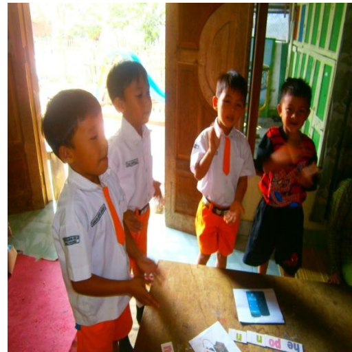
Mendapat hukuman bernyanyi karena kalah cepat dengan kelompok lain dalam melakukan kegiatan menyusun kata nama gambar