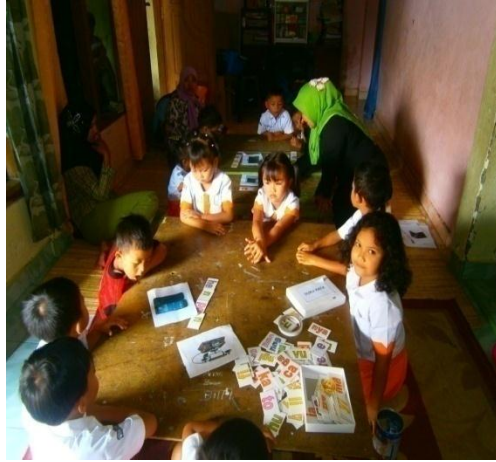
Menyusun suku kata membentuk kata nama gambar