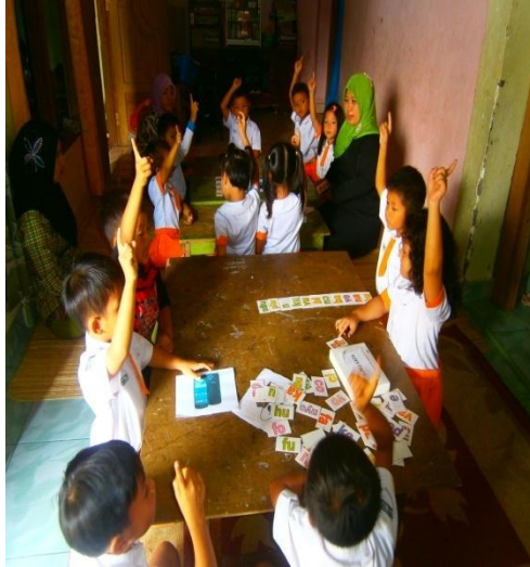
Acungkan jari tanda mau ditunjuk main tebak suku kata