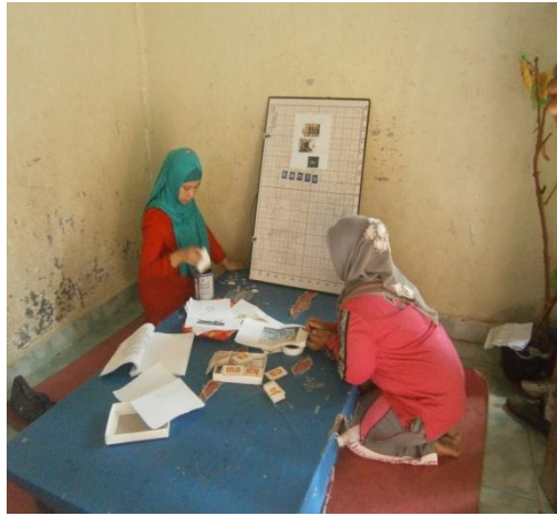
Guru menyiapkan bahan ajar kegiatan