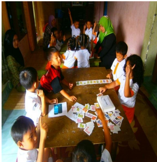
Acungkan jari tanda mau mendapat giliran dalam kegiatan menyusun kata nama gambar