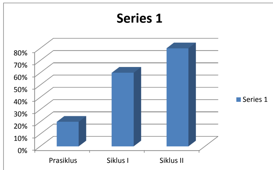
Grafik 4.1 Peningkatan Hasil Penelitian

Dari hasil kegiatan prasiklus siklus I dan siklus II hasilnya ditunjukkan dengan grafik sebagai berikut: