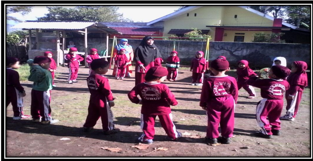
Gambar 18. Guru dan anak-anak sedang bermain melempar dan menangkap bola sedang