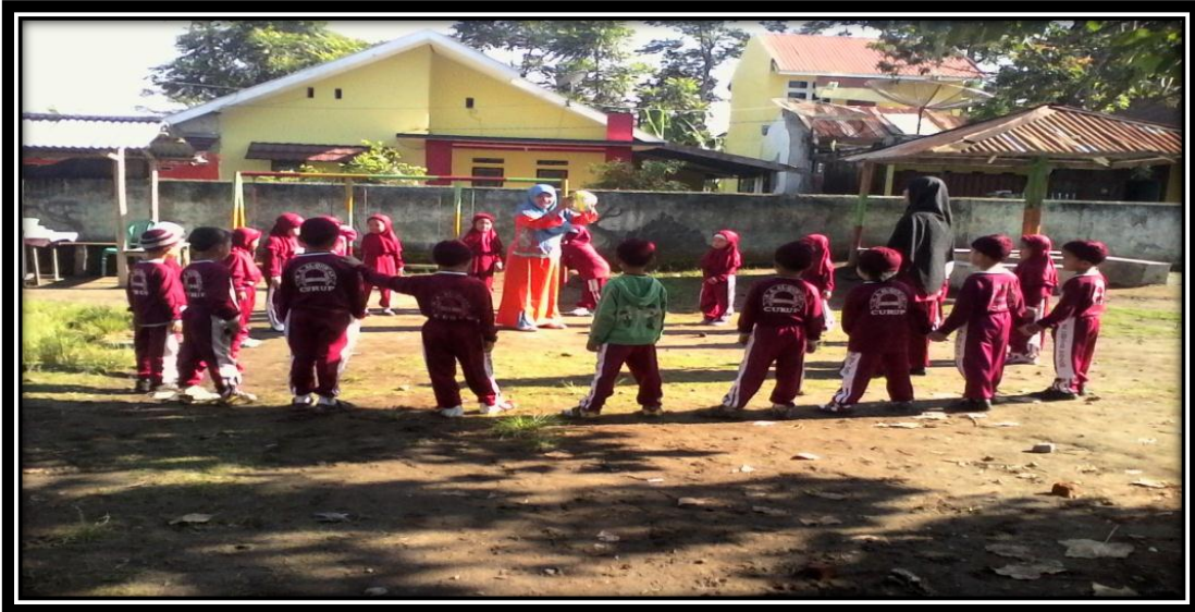
Gambar 16. Guru dan kolaborator memberikan contoh cara yang benar melempar dan menangkap bola sedang