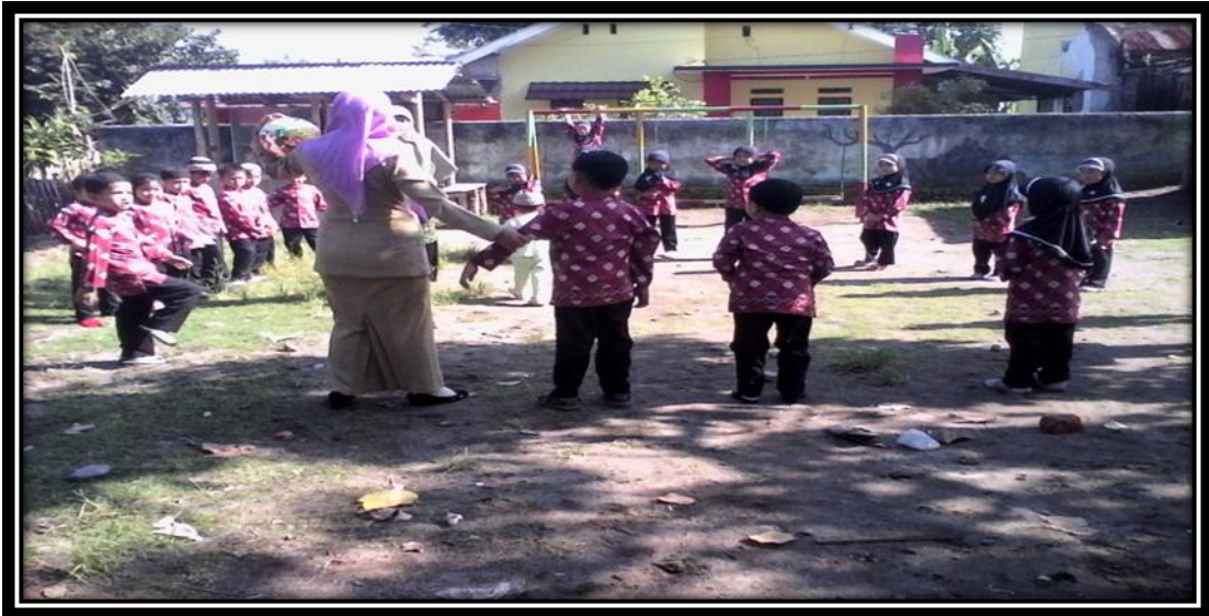
Gambar 12. Guru dan kolaborator sedang mengatur barisan anak-anak