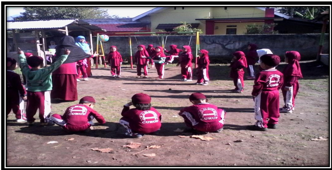
Gambar 19. Guru dan anak-anak sedang bermain melempar dan menangkap bola sedang