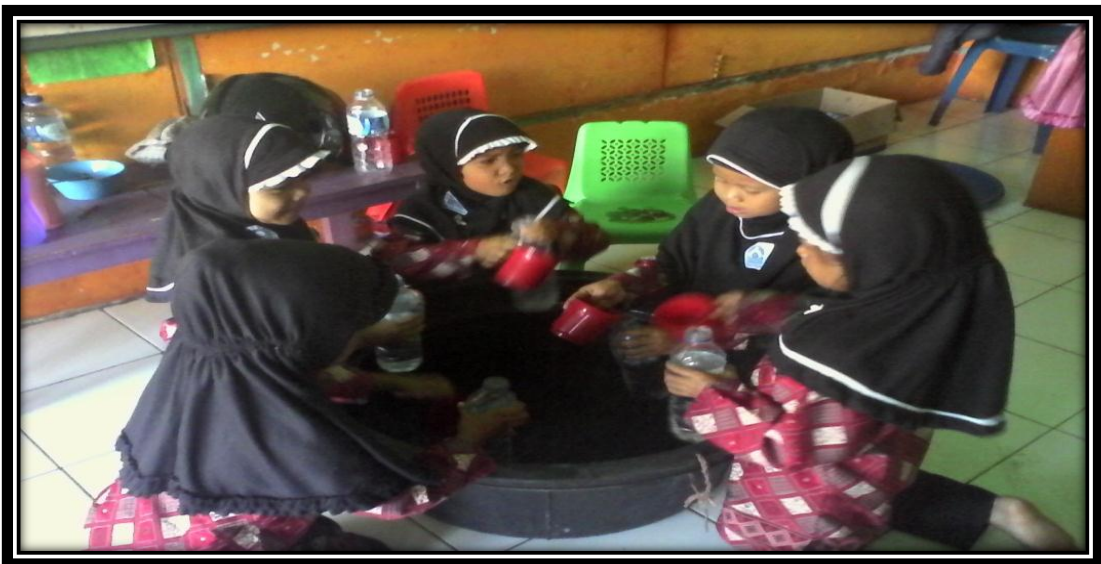
Gambar 11. Anak perempuan sedang memasukan air ke dalam botol