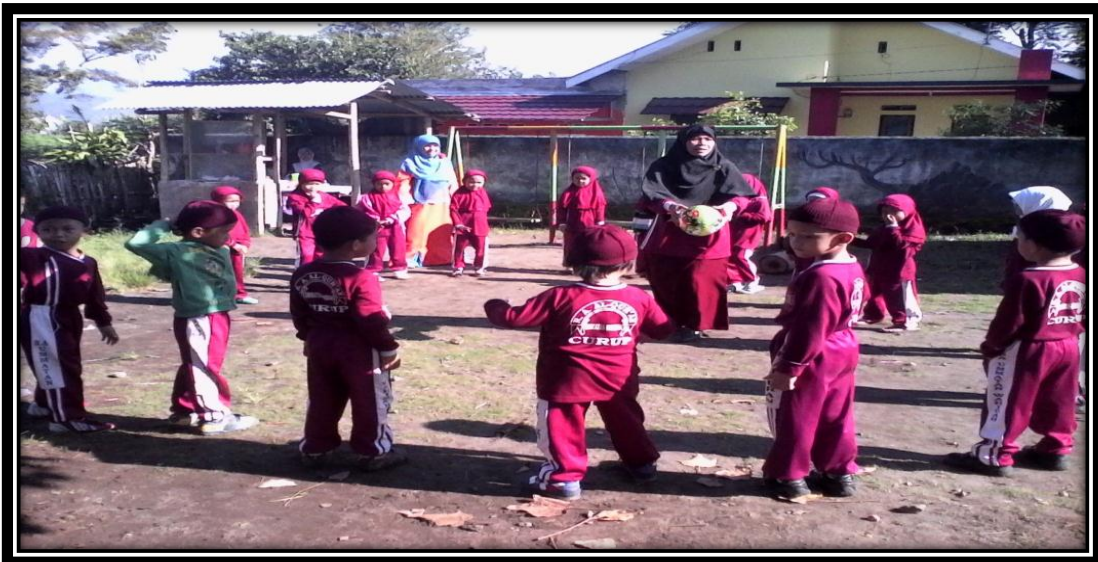
Gambar 17. Guru dan anak-anak sedang bermain melempar dan menangkap bola sedang