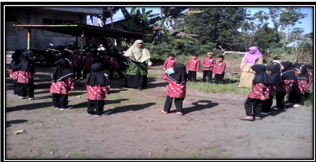
Gambar 15. Guru dan anak-anak sedang bermain melempar dan menangkap bola sedang