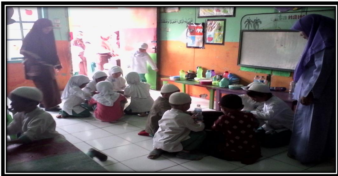
Gambar 7. Anak sedang memasukan air ke dalam botol