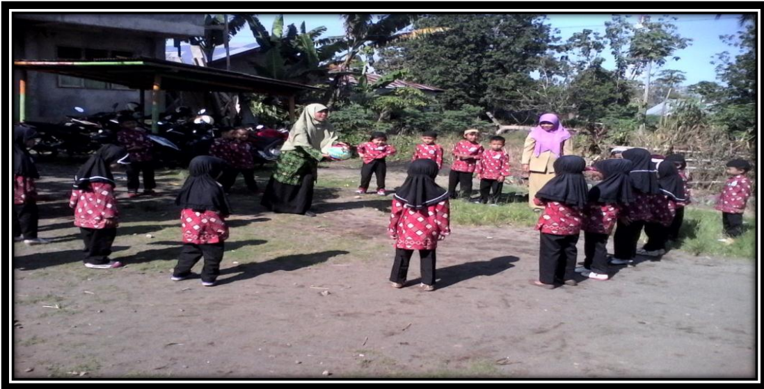
Gambar 14. Guru dan anak-anak sedang bermain melempar dan menangkap bola sedang