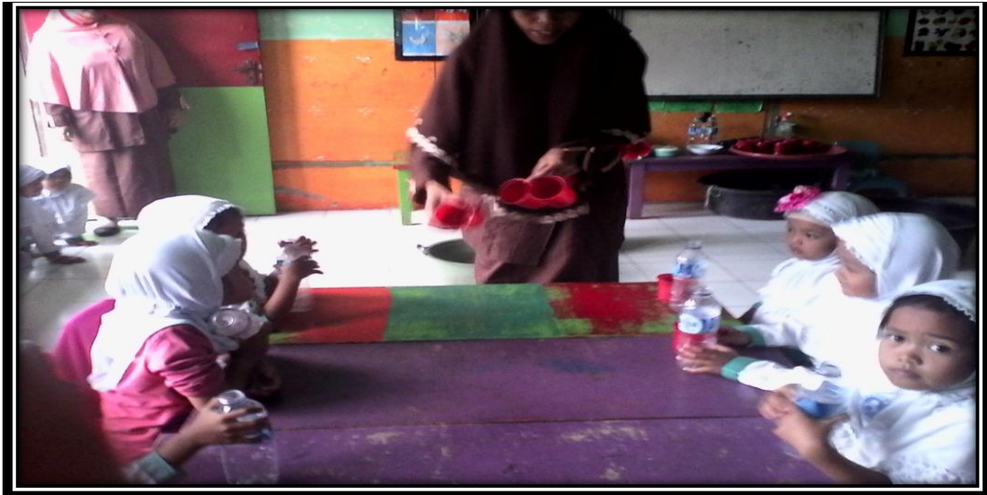
Gambar 6. Peneliti memberikan media yang digunakan dalam bermain eksplorasi benda pada anak yaitu cangkir dan botol