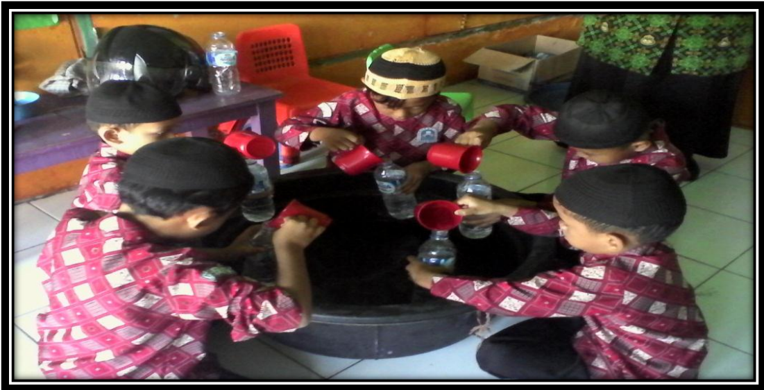
Gambar 10. Anak laki-laki sedang memasukan air ke dalam botol