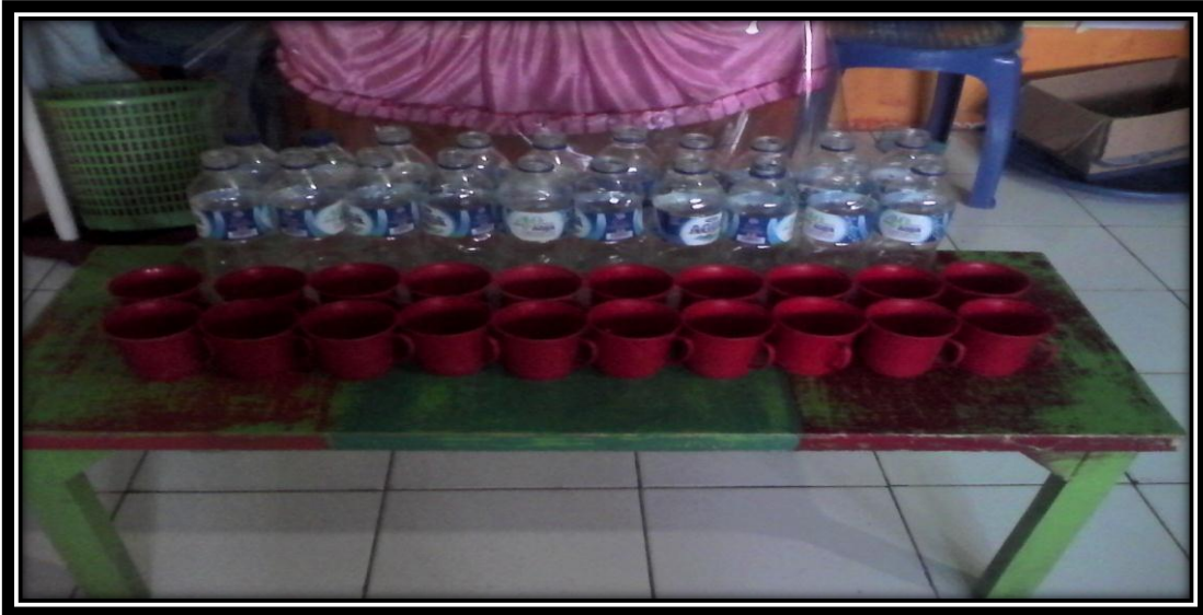
Gambar 4. Media yang digunakan dalam bermain eksplorasi benda yaitu memasukan air ke dalam botol