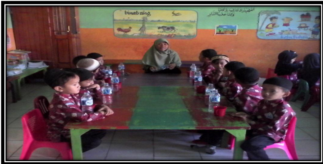
Gambar 8. Guru memberikan penjelasan tentang manfaat air