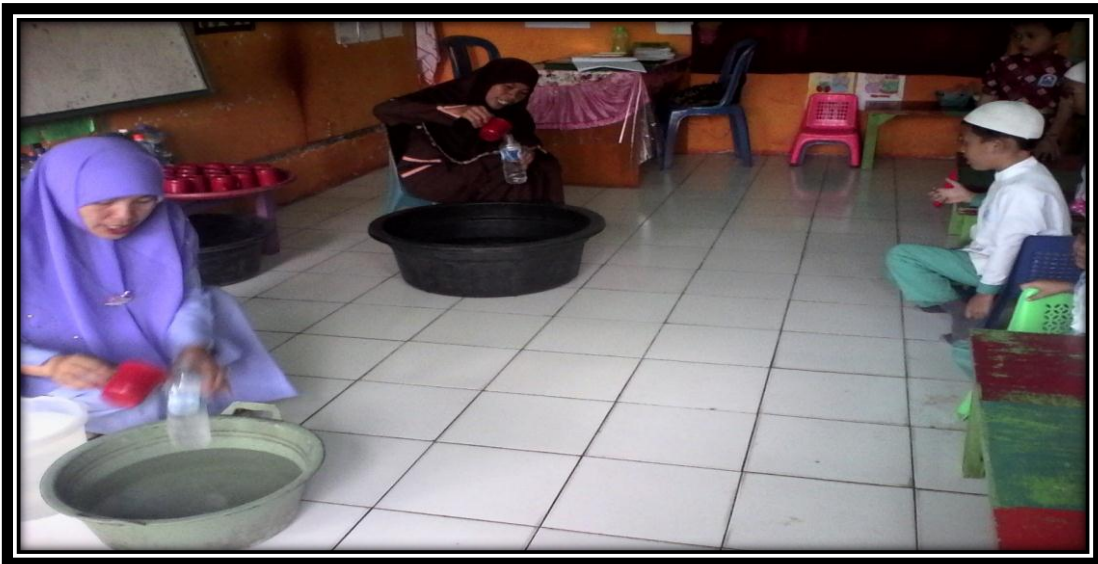
Gambar 5. Peneliti/guru dibantu oleh kolaborator sedang mempraktekkan cara bermain eksplorasi benda yaitu memasukan air ke dalam botol