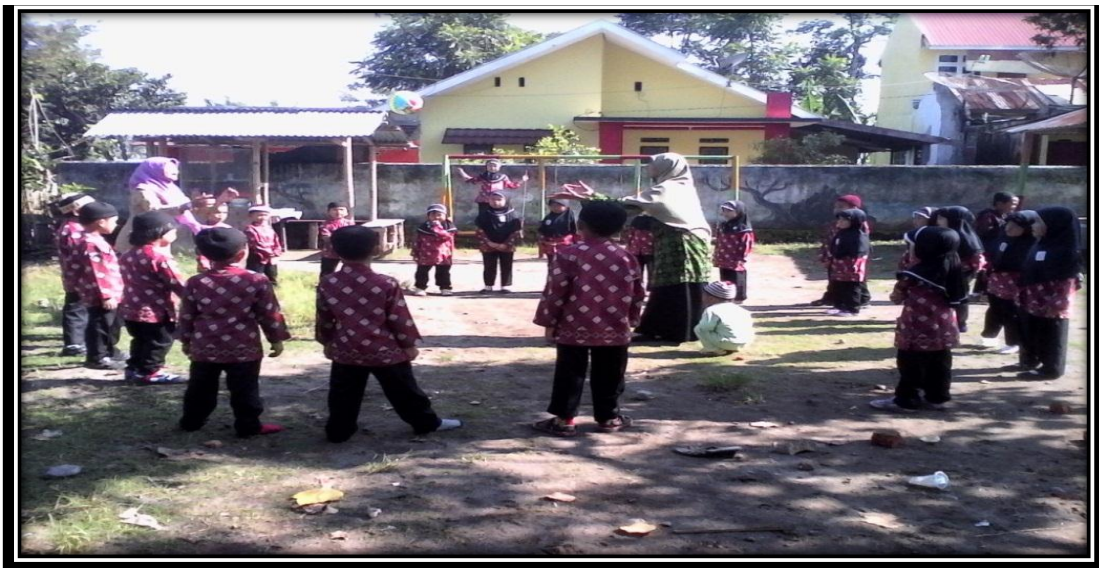
Gambar 13. Guru dan kolaborator mempraktekkan cara menangkap dan melempar bola sedang