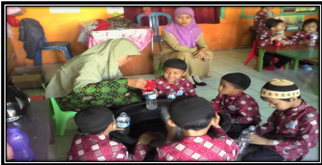
Gambar 9. Guru memberikan contoh cara memasukan air ke dalam botol tanpa tumpah