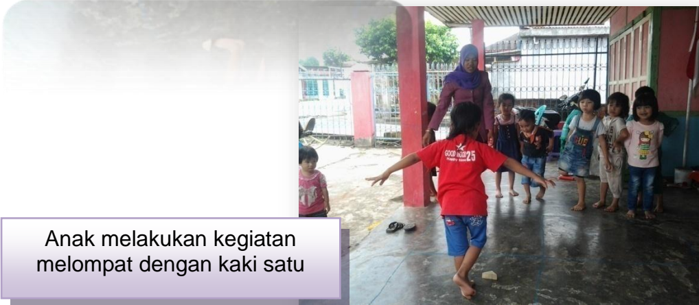
Anak melakukan kegiatan melompat dengan kaki satu