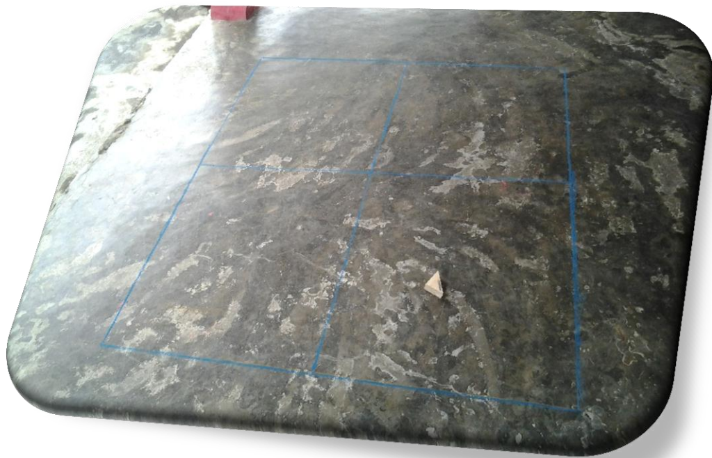
Pola Permainan Lembar Tabak