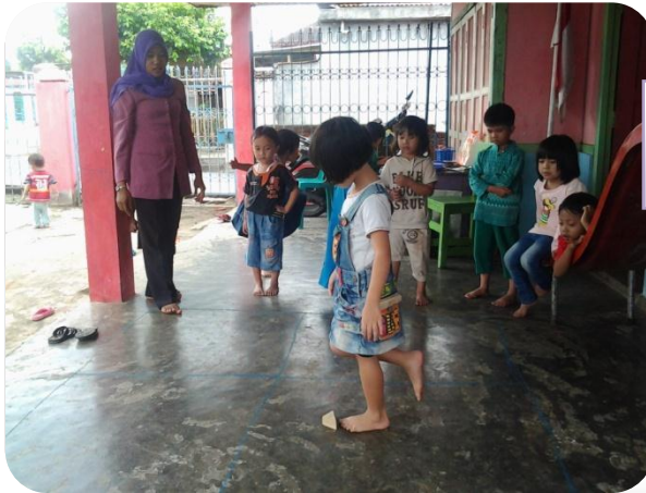
Anak melakukan kegiatan melompat dengan kaki satu