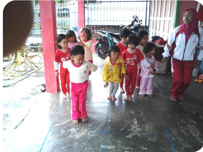
Anak melakukan kegiatan melompat dengan kaki dua secara bersamaan