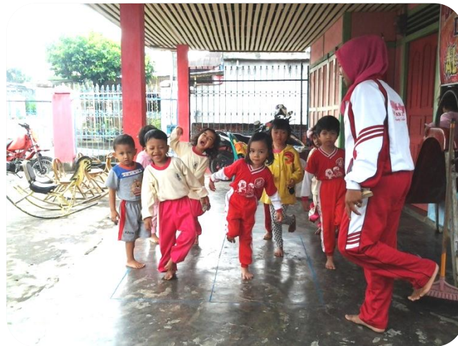
Anak melakukan kegiatan melompat dengan kaki satu seperti pesawat terbang