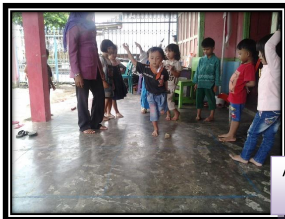
Anak belum mampu melakukan kegiatan melompat