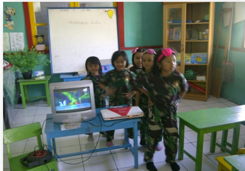
Anak-anak Bernyanyi Sambil Menari