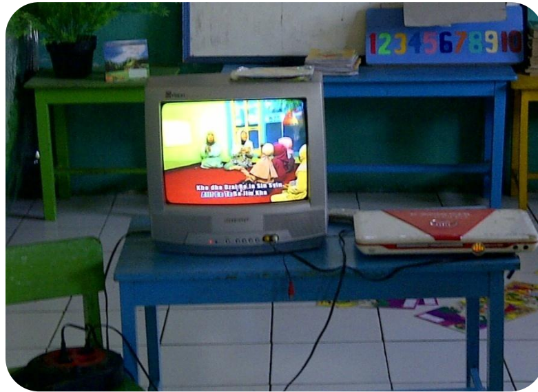
Media Audiovisual Berupa VCD dan Televisi