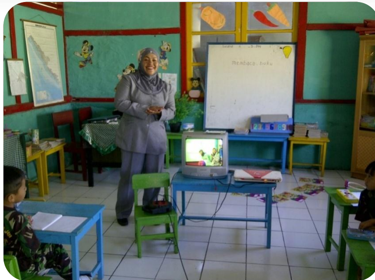
Peneliti Sedang Memberikan Pengarahan Kepada Siswa Siswi