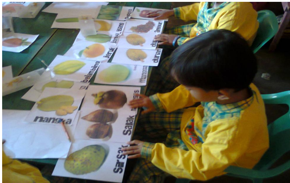
Membaca dua suku kata