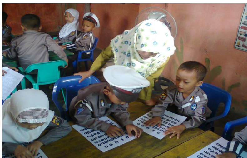
Anak menunjuk huruf yang ditanyakan guru