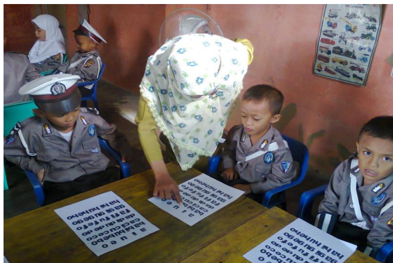
Anak belajar mengenal huruf Vokal