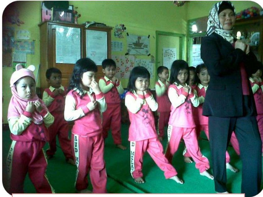
Pengenalan Tema / Sub Tema dan Gerakan Tari Kreasi Burung I avang-lavang