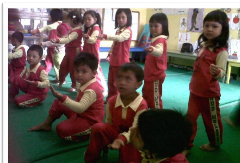
Penulis Memperagakan Gerakan Tari Kreasi Kreasi Burung