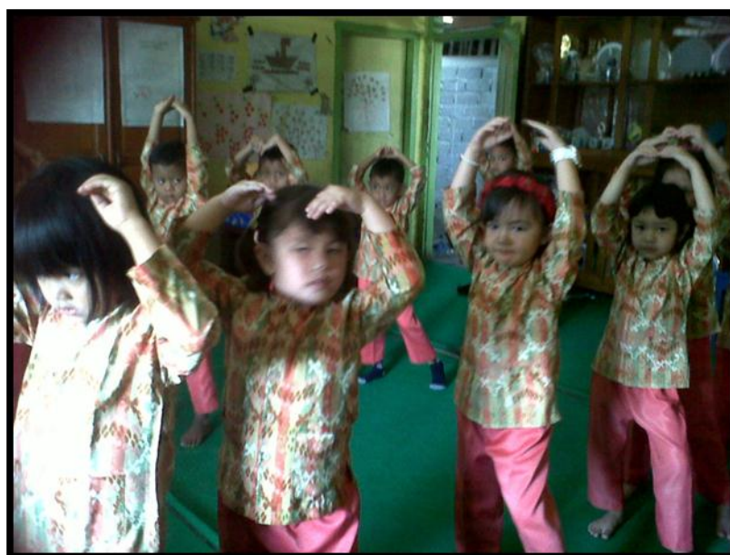
Anak Memperagakan Gerakan Tari Kreasi Kreasi Burung Layang-layang