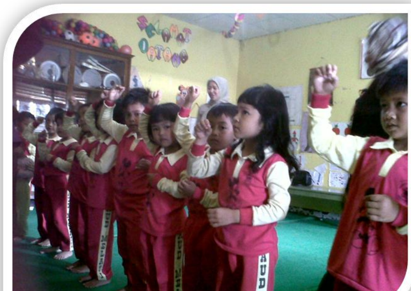
Penulis Memperagakan Gerakan Tari Kreasi Burung Layang-layang