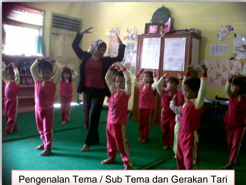
Pengenalan Tema / Sub Tema dan Gerakan Tari Kreasi Burung I avang-lavang