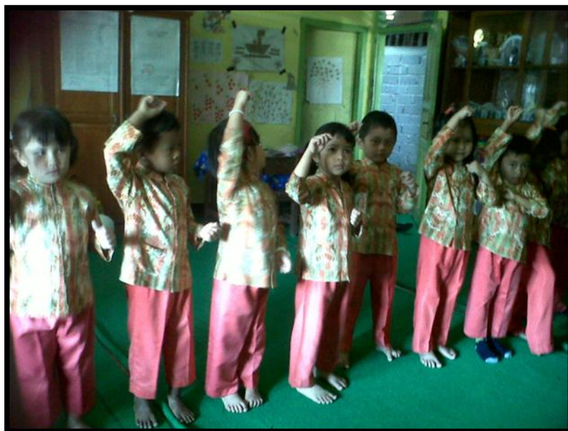
Anak Memperagakan Gerakan Tari Kreasi Kreasi Burung Layang-layang