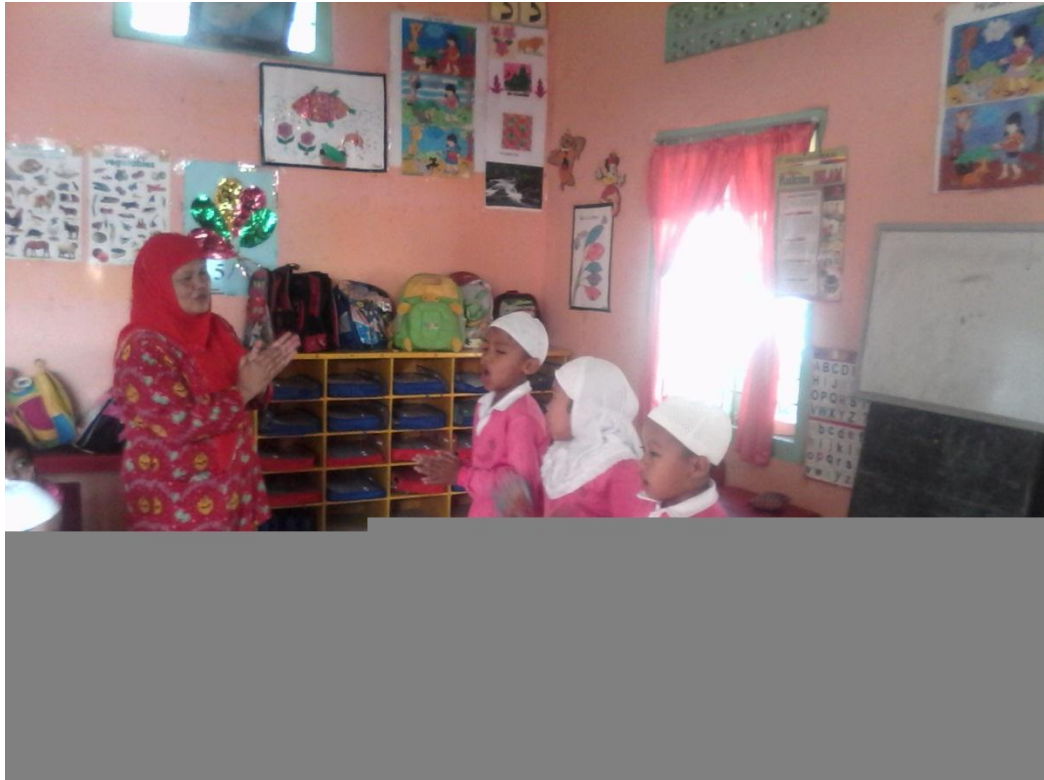
Tiga Orang Murid Yang Mempraktekkan Bernyayi Lagu Islamiah