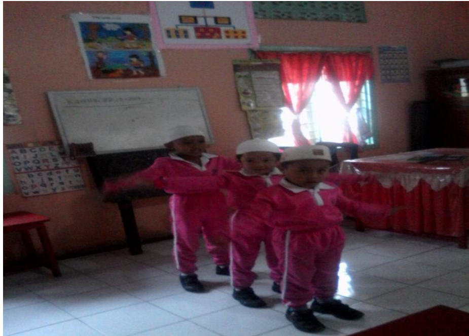
Memperaktekkan Bernyanyi Lagu Islamiah didepan Lokal dengan Gerakan