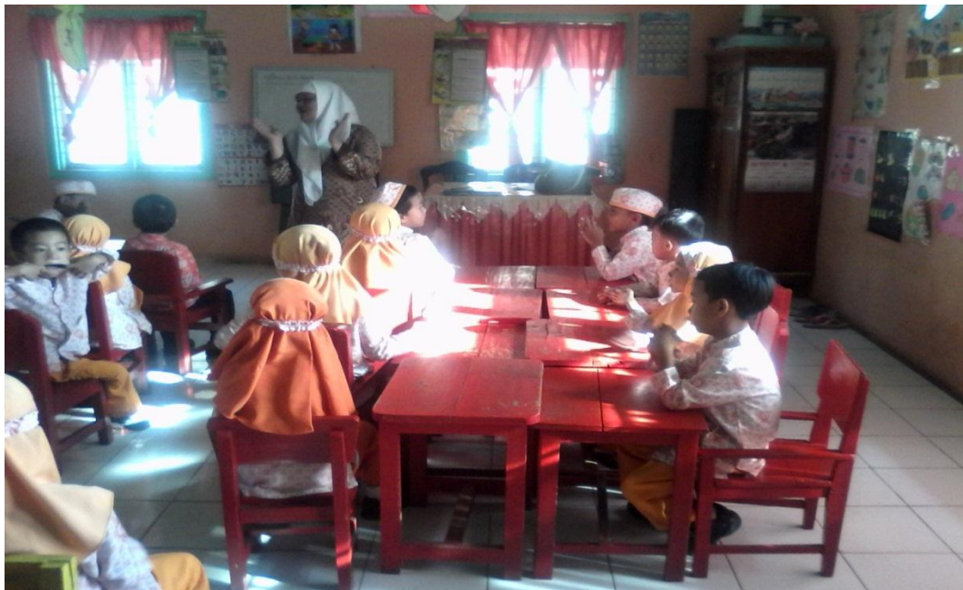
Gambar Aktivitas Siklus 1 Pertemuan Kedua