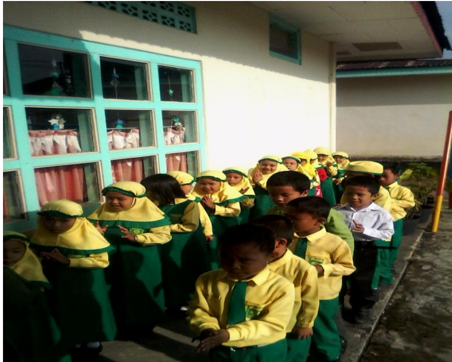
Bernyanyi Lagu-Lagu Islamiah Bersama Sebelum Masuk Kedalam Lokal dengan Gerakan