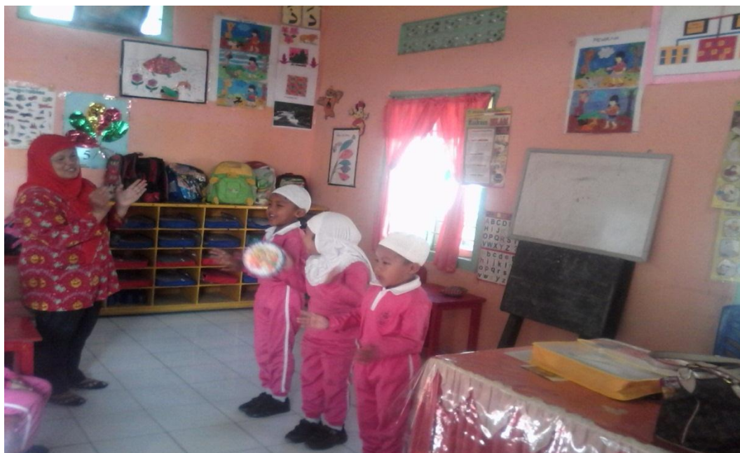
Gambar Aktivitas Siklus 1 Pertemuan Ketiga