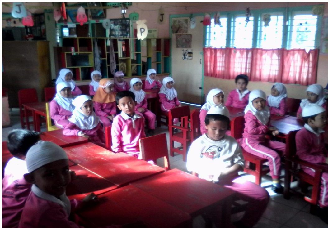
Gambar Aktivitas Siklus 1 Pertemuan Pertama