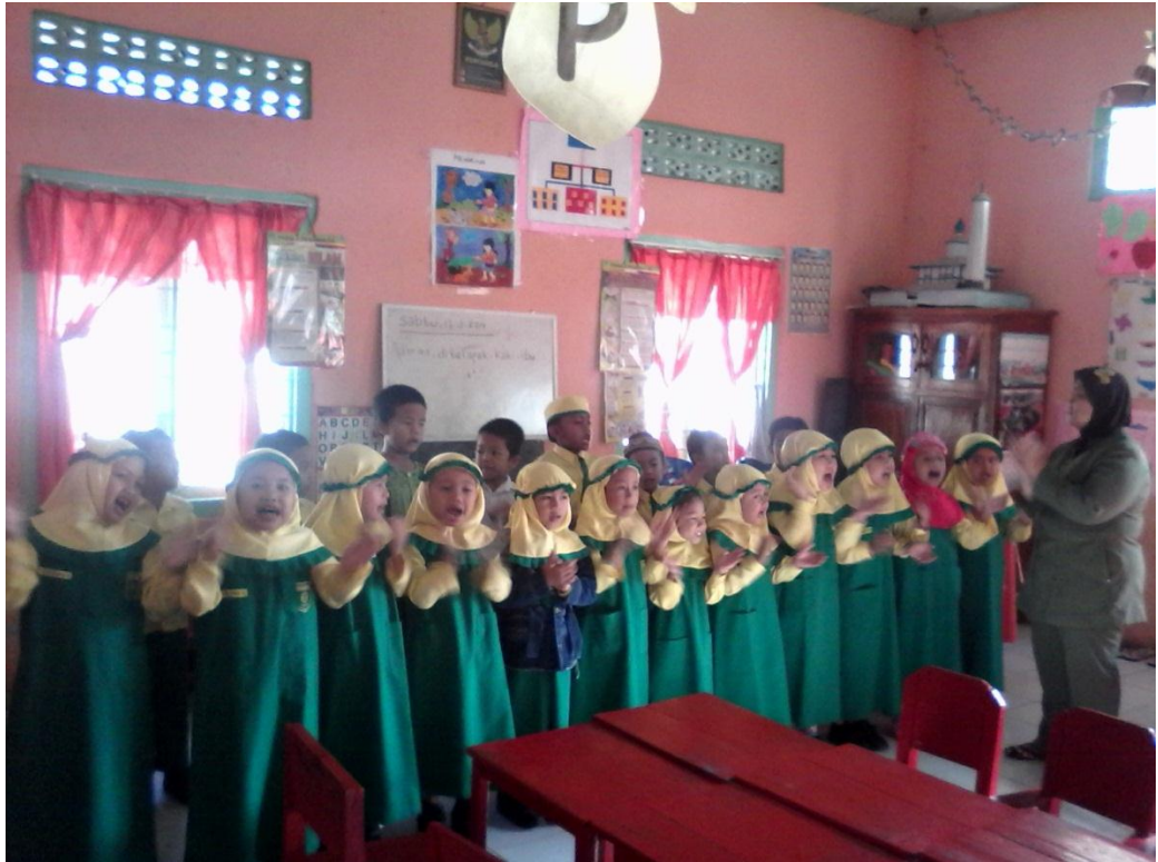
Bernyanyi Bersama-sama didepan Lokal