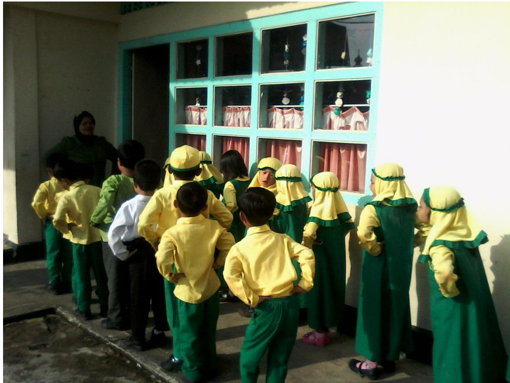
Gambar Aktivitas Siklus 2 Pertemuan Pertama