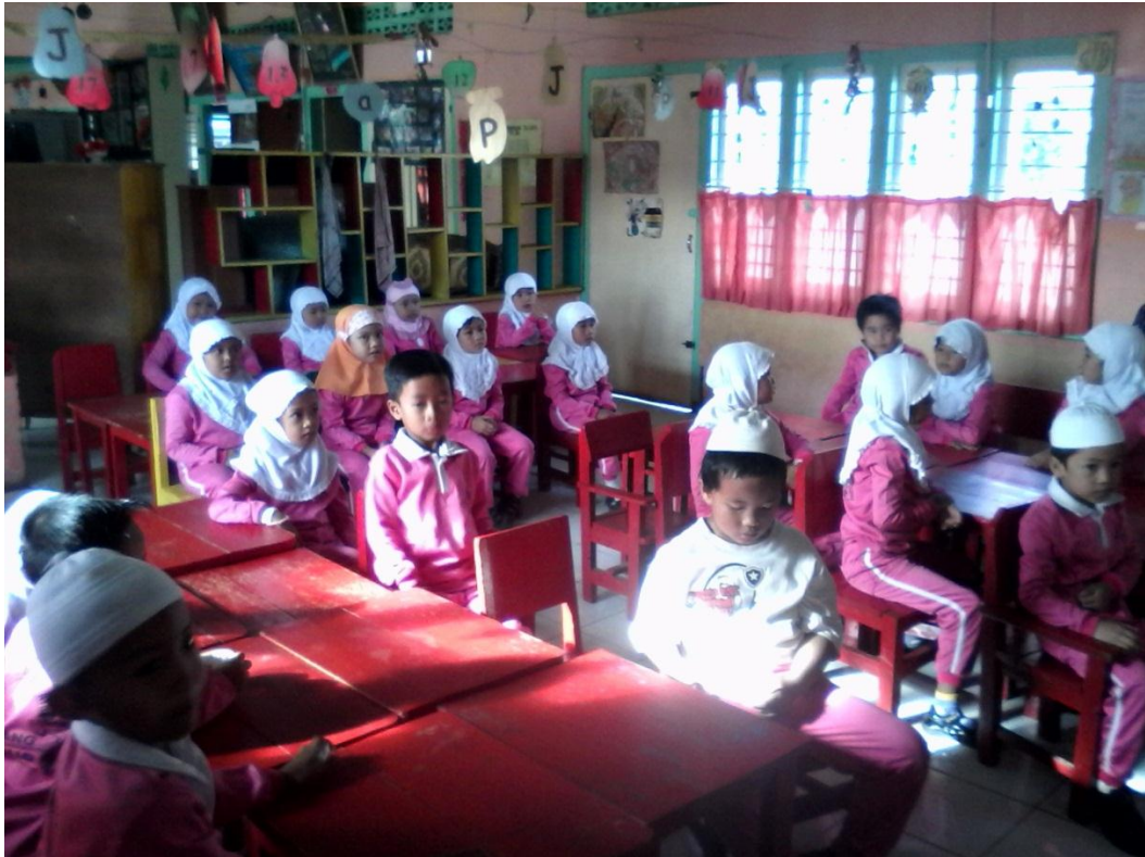
Menjelaskan Lagu-Lagu Islami Kepada Murid