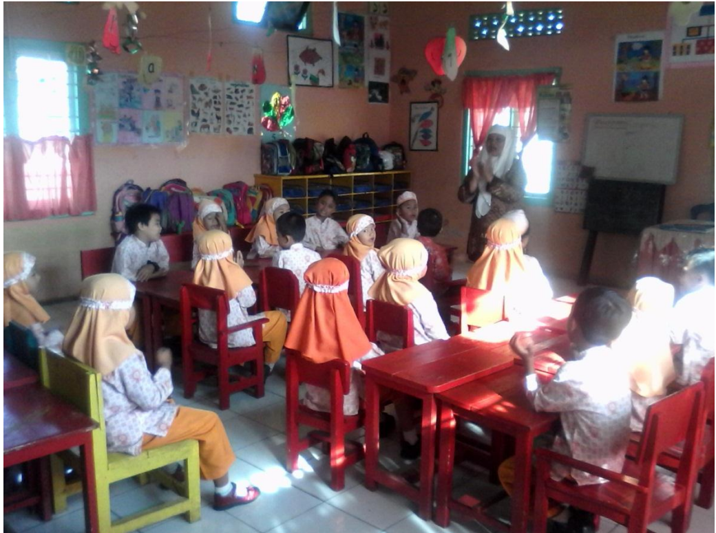
Bernyanyi Lagu-Lagu Islamiah Bersama Didalam Lokal