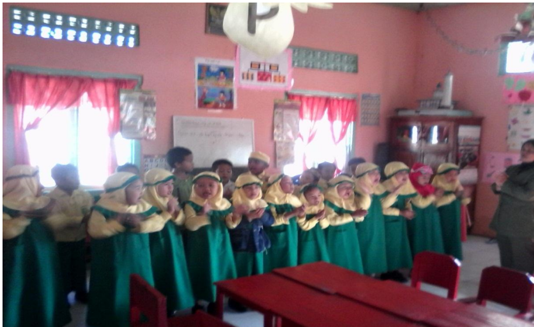
Gambar Aktivitas Siklus 2 Pertemuan Ketiga