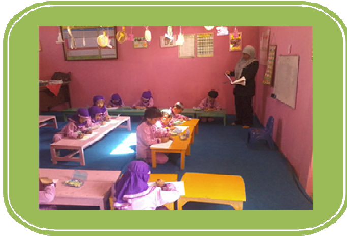
Kegiatan siklus II pertemuan 1 Anak-anak mewarnai gambar banjir dan Gunung meletus