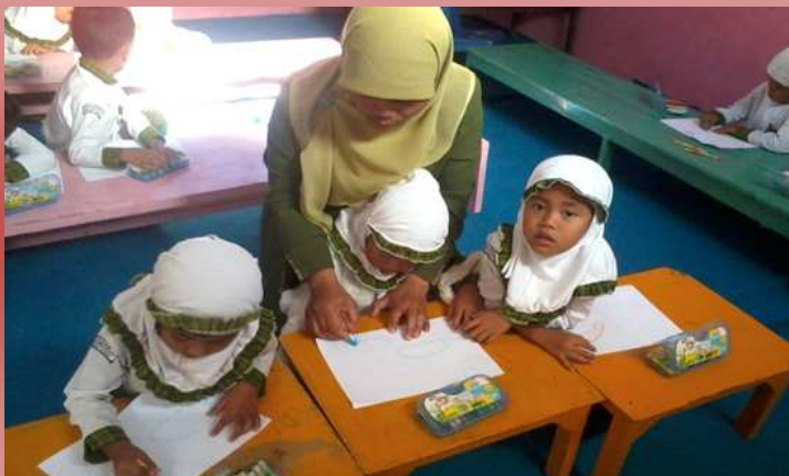
Photo kegiatan Pembelajaran