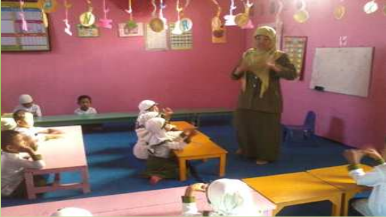
Peneliti menjelaskan materi tentang gejala Alam tentang awan,hujan,dan pelangi