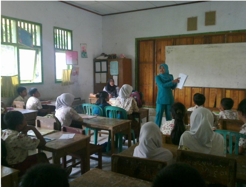
Gambar 1.1 Penelitimen jelaskan petunjuk pengisian angket