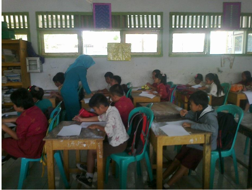
Gambar 1.5 Peneliti membimbing siswa dalam pengisian angket.