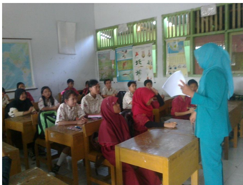
Gambar 1.4 Peneliti menjelaskan petunjuk pengisian angket