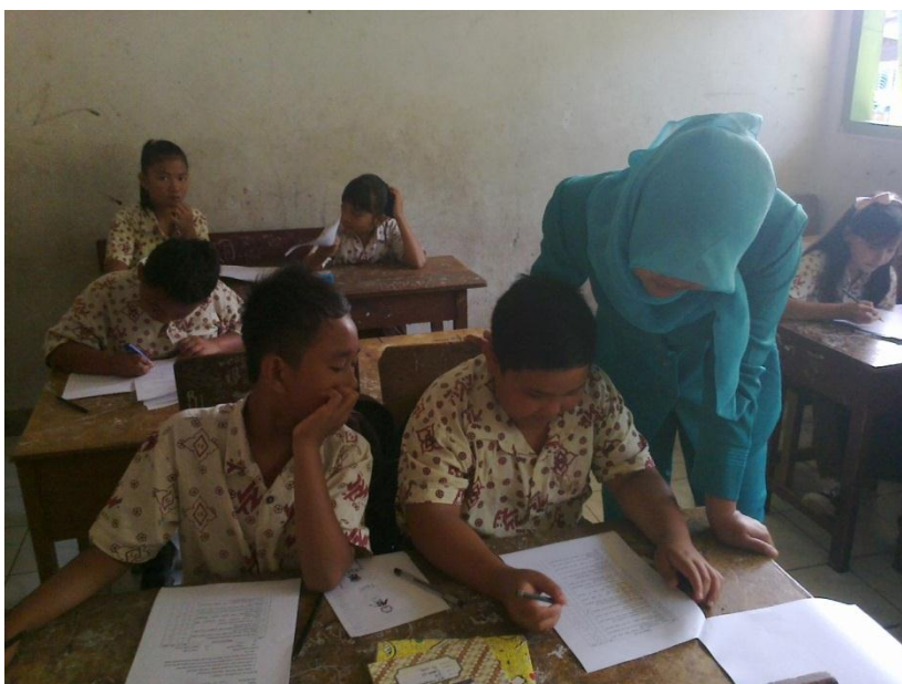
Gambar 1.3 Peneliti membimbing siswa dalam pengisian angket