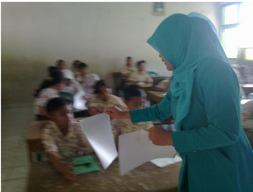
Gambar 1.2 Peneliti membagikan angket uji instrument kepada populasi di luar sampel penelitian