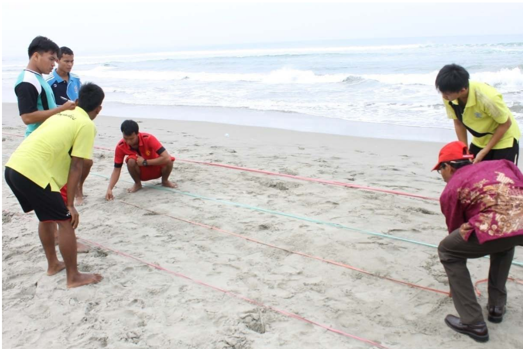
MENGUKUR PANJANG LANGKAH