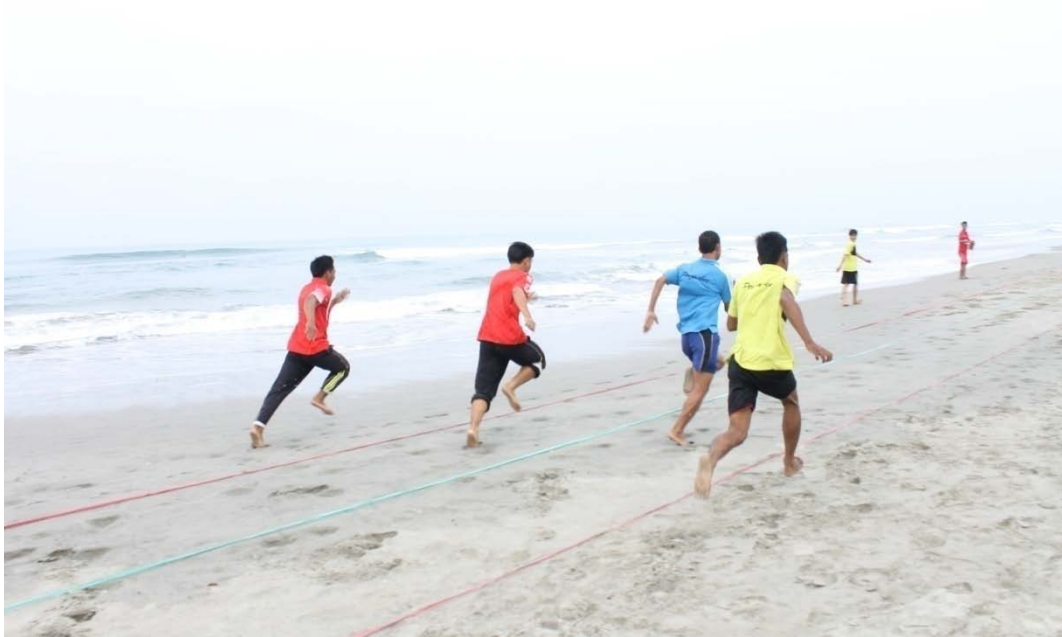
SAAT BERLARI UNTUK PENGAMBILAN DATA PANJANG LANGKAH