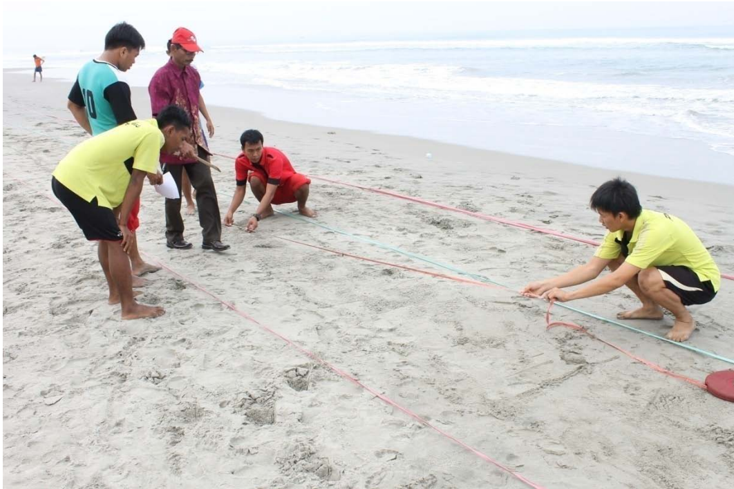
MENGUKUR PANJANG LANGKAH