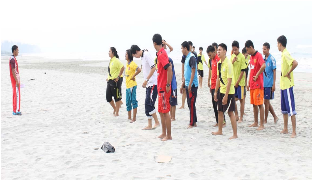
PEMBERIAN INSTRUKSI INSTRUMEN YANG AKAN DILAKUKAN