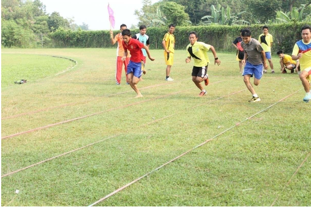
PENGAMBILAN DATA LARI SPRINT 100 METER