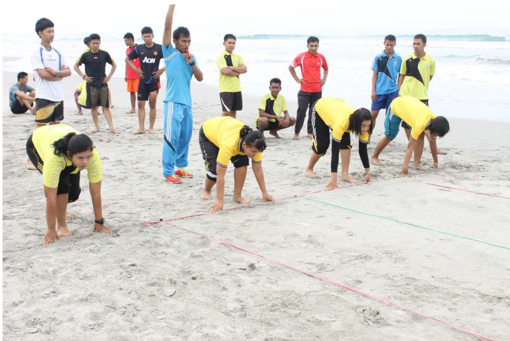
START UNTUK PENGAMBILAN DATA PANJANG LANGKAH