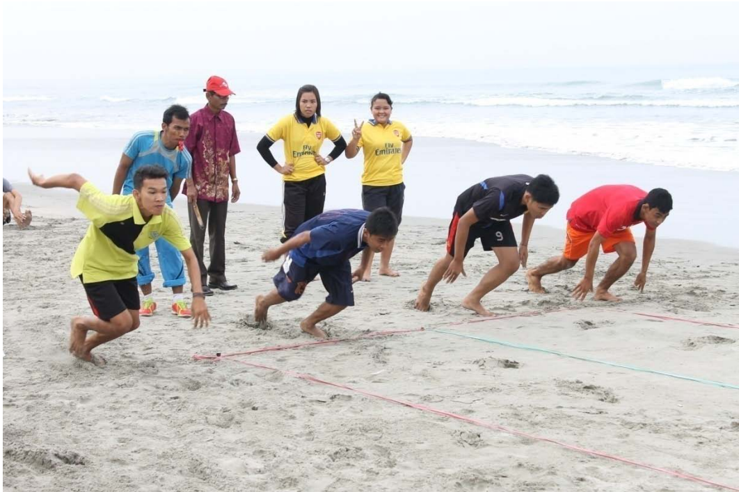
STAR PADA ABA-ABA “YA” DATA PANJANG LANGKAH