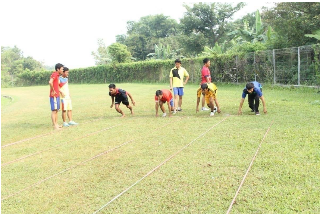
START UNTUK PENGAMBILAN DATA SPRINT