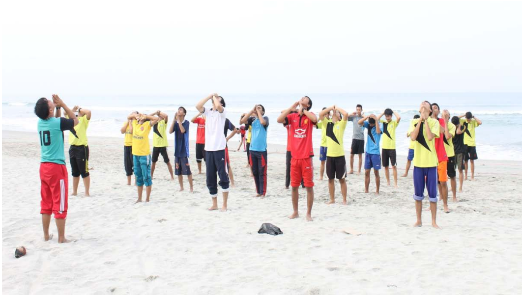
MELAKUKAN PEMANASAN SEBELUM TES PANJANG LANGKAH