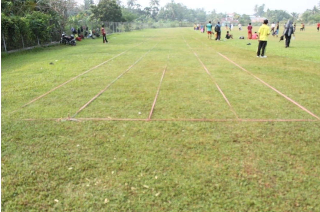
LINTASAN UNTUK LARI SPRINT 100 METER