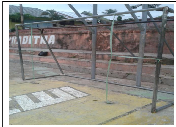
Foto 6. Gambar Gawang Futsal Yang Telah Diberi Sket Penilaian