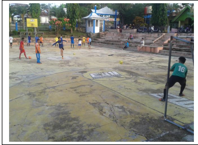
Foto 7. Pemain Melakukan Shooting