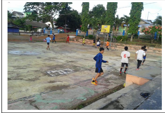
Foto 1. Pemain Melakukan Pemanasan