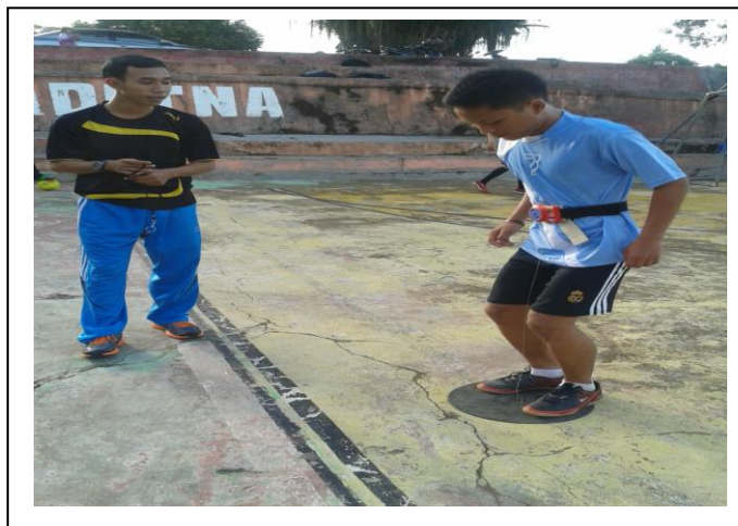
Foto 4. Pemain Sedang melakukan vertical jump