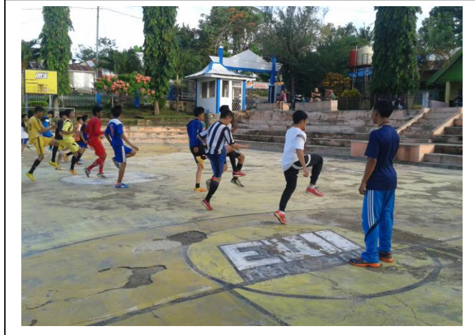
Foto 3. Pemain Sedang Latihan Kekuatan Otot Kaki