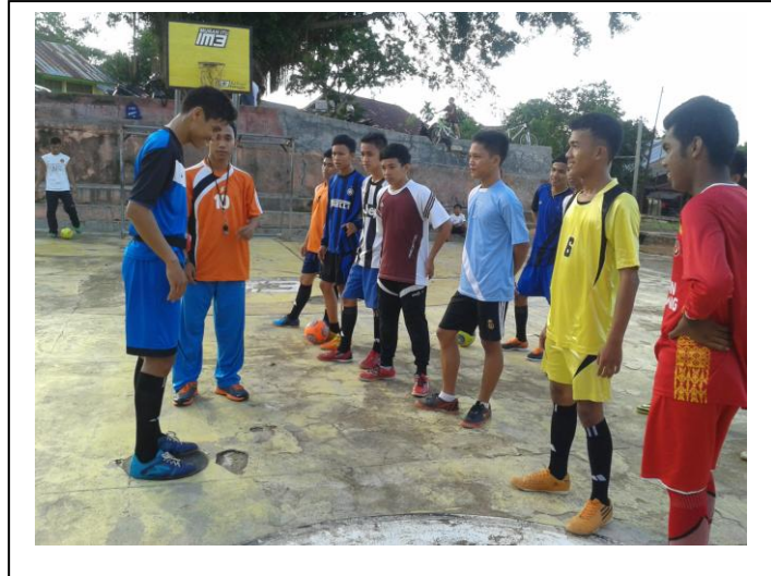
Foto 5. Pengukuran hasil vertical jump