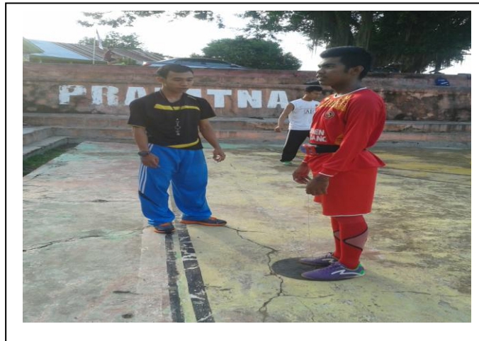
Foto 2. Pemain sedang di ukur hasil vertical jump