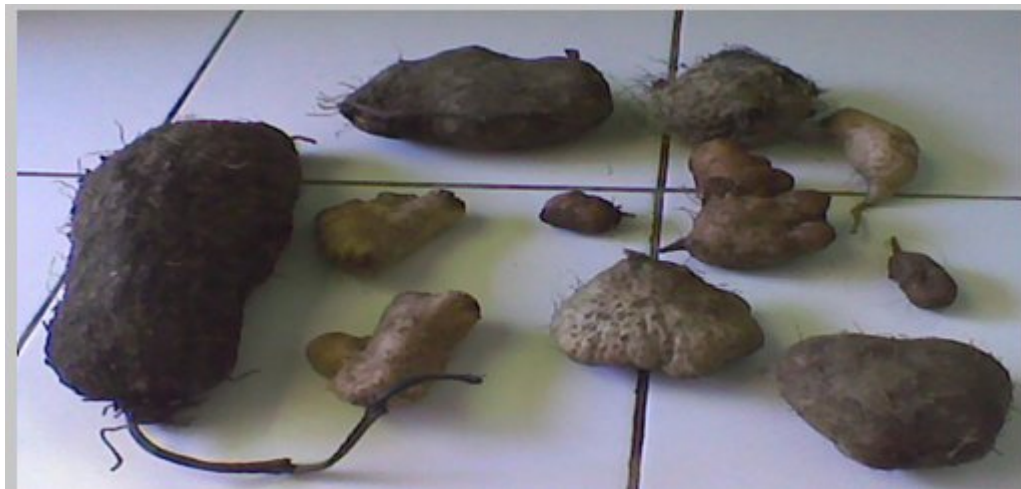
Gambar 1. Variasi bentuk dan ukuran umbi uwi koleksi

Penampilan fisik umbi uwi yang dikoleksi sangat bervariasi, baik ukuran, bentuk, dan warna daging umbi sesuai dengan jenisnya (Gambar 1). Ukuran umbi ada yang sangat besar, hingga mencapai lebih dari 3 kg umbi -1 , tetapi ada juga yang kecil hanya sekitar 100 g umbi -1 . Bentuk umbi ada yang tidak beraturan, lonjong, hingga bulat. Daging umbi ada yang berwarna putih, kuning kecokelatan, hingga ungu. Uwi yang biasa disebut uwi kelapa, sego, atau uwi putih memiliki umbi tunggal, berbentuk tidak beraturan dengan ukuran yang cenderung besar, daging umbi warna putih kecokelatan dengan warna kulit kuning kecokelatan hingga ungu kehitaman. Sedangkan jenis uwi yang serupa uwi kelapa tetapi dengan kulit dan daging umbi warna ungu dikenal dengan nama daerah uwi senggani. Uwi jenis ini termasuk dalam spesies Dioscorea alata (French, 2006).