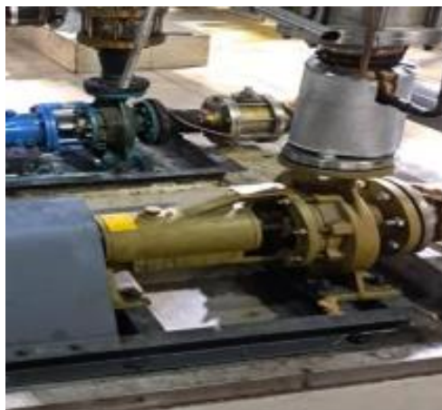
Gambar 2.3 Pompa Sentrifugal Kewpump

Pompa Sentrifugal Kewpump Merupakan pompa yang berfungsi untuk mengalirkan air dari tempat yang bertekanan rendah ke tempat yang bertekanan tinggi dimana PT. Incasi Raya menggunakan pompa sentrifugal Kewpump untuk mengalirkan Proses produksi minyak goreng dari tangki T611 menuju ke Niagara Filter. Dimana pada Pompa sentrifugal merk Kewpump dengan type Ks-se, model 65-160, Ter no SW 0011053 EE 17, Memiliki IMP size 174 mm, Ins (Diameter) 175 mm, Q 62m 3 /hr, H 35 m, dan memiliki Kecepatan putaran N 2900 rpm