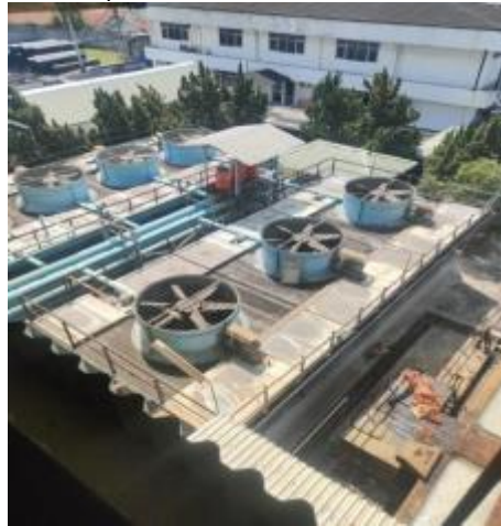
Gambar 2.1 Incasi Raya

Hingga saat ini PT. Incasi Raya Minyak Goreng By Pass Padang sudah bisa memproduksi sekitar 1000 ton minyak goreng per hari. Hasil produksi sudah dikonsumsi di dalam negeri dengan nama produk “SARI MURNI” dan sebagian besar di ekspor dengan nama produk “GURIH” ke negara-negara tetangga. Untuk meningkatkan kualitas ekspor PT. Incasi Raya Minyak Goreng By Pass Padang selalu meningkatkan segel sebagai upaya untuk mencapai target serta memenuhi standar ekspor.